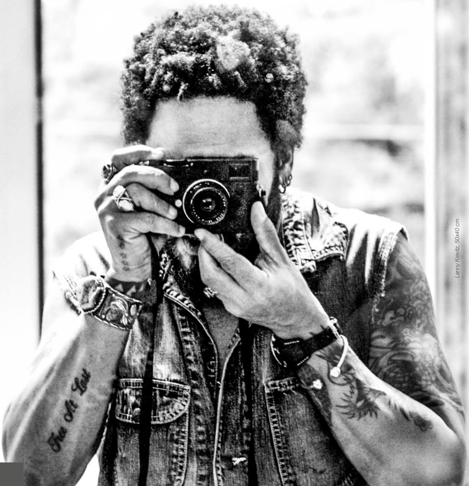
Lenny Kravitz, 50x40 cm