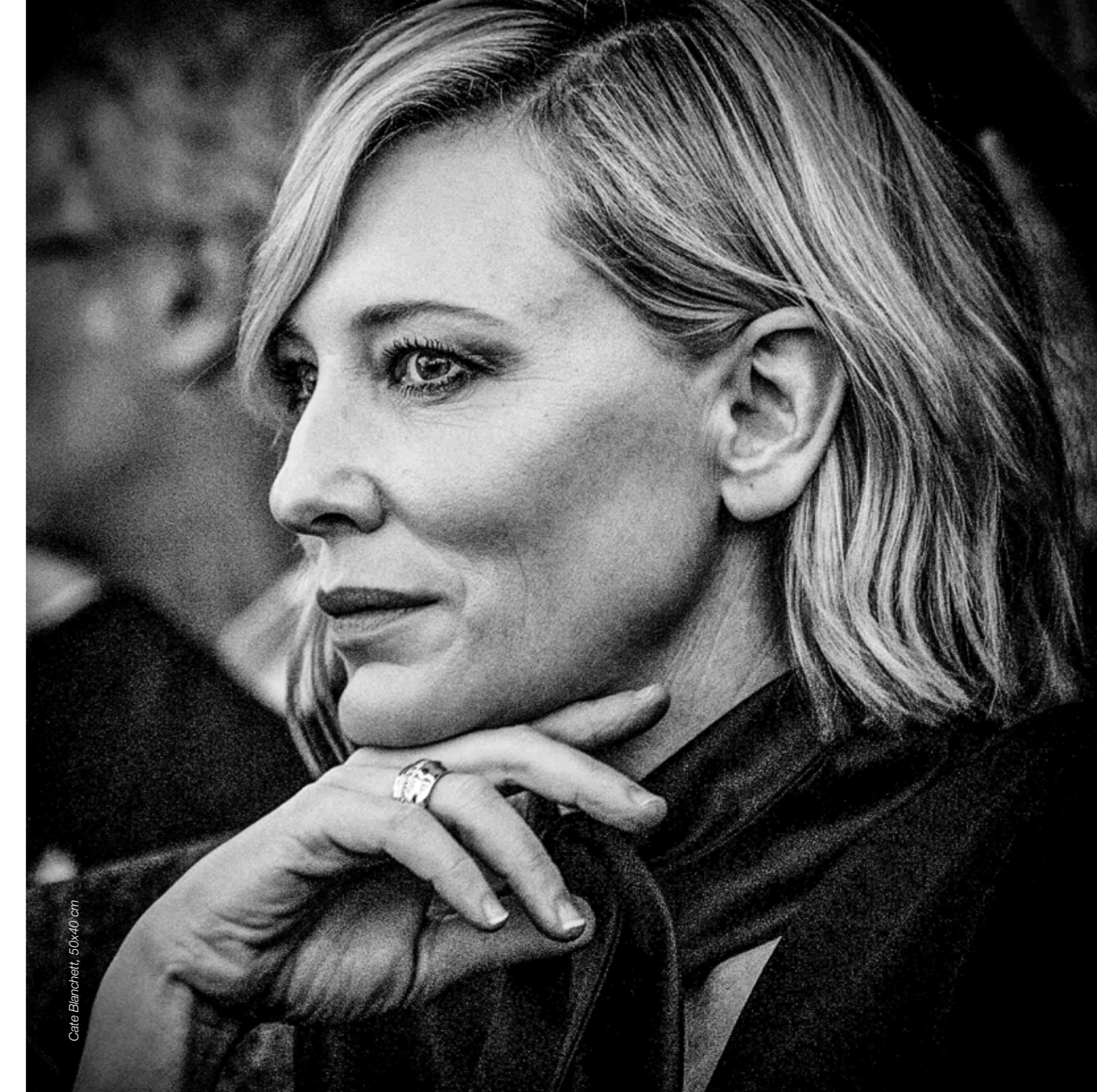
Cate Blanchett, 50x40 cm