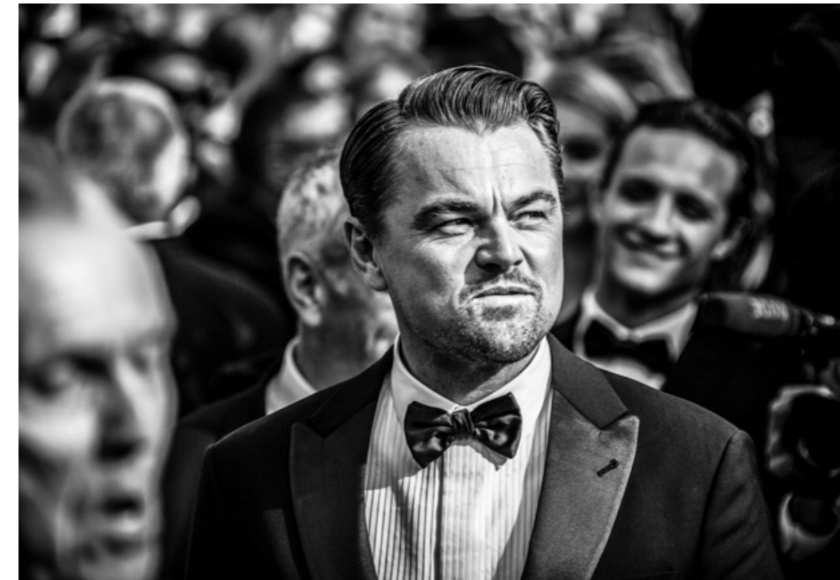
Leonardo Di Caprio, 45x60 cm

Karim Rahomas natürliche Art Menschen mit der Fotokamera einzufangen ist einzigartig. Er schafft es, die Menschen selbst im größten Getümmel, wie am roten Teppich – der einer Wüste von Wahrheit und Authentizität gleicht und wo es sonst um eine perfekte Inszenierung geht – in einem Moment der Einsamkeit einzufangen.