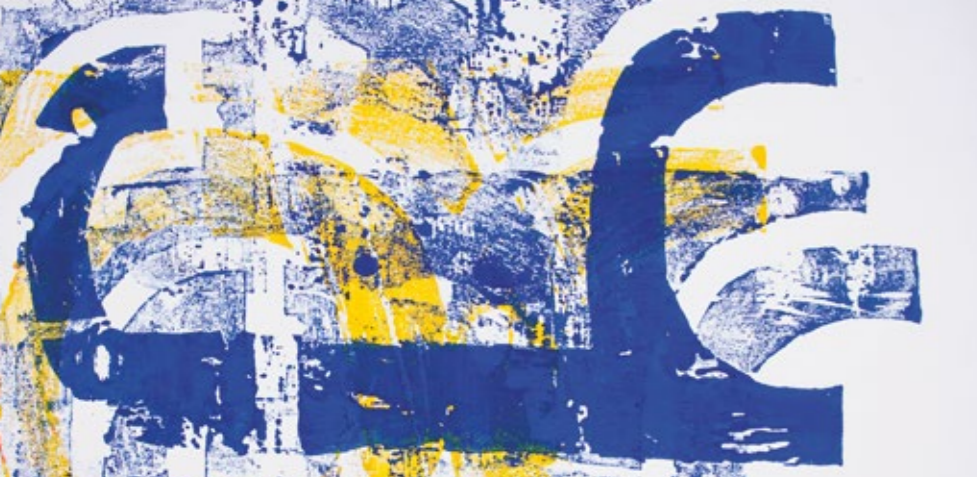
Frottage von Druckstock erpe Vienna, 1998 | Zyklus Holz & Farbe

Für den eigentlichen Druckprozess wird die Skulptur von alle Seiten bemalt und in verschiedenen Stufen entweder nur mit einer Seite oder mit mehreren Seiten übereinander auf Papier gedruckt (frottageiert).