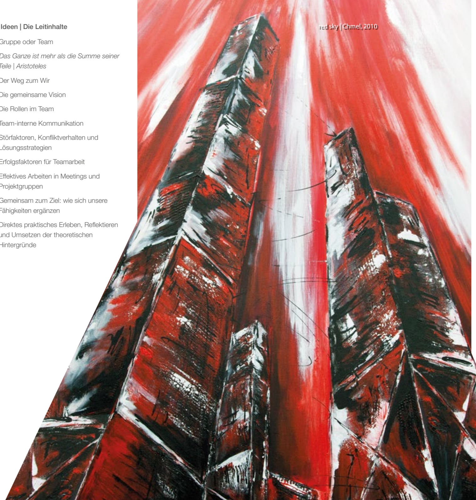
red sky | Chmel, 2010