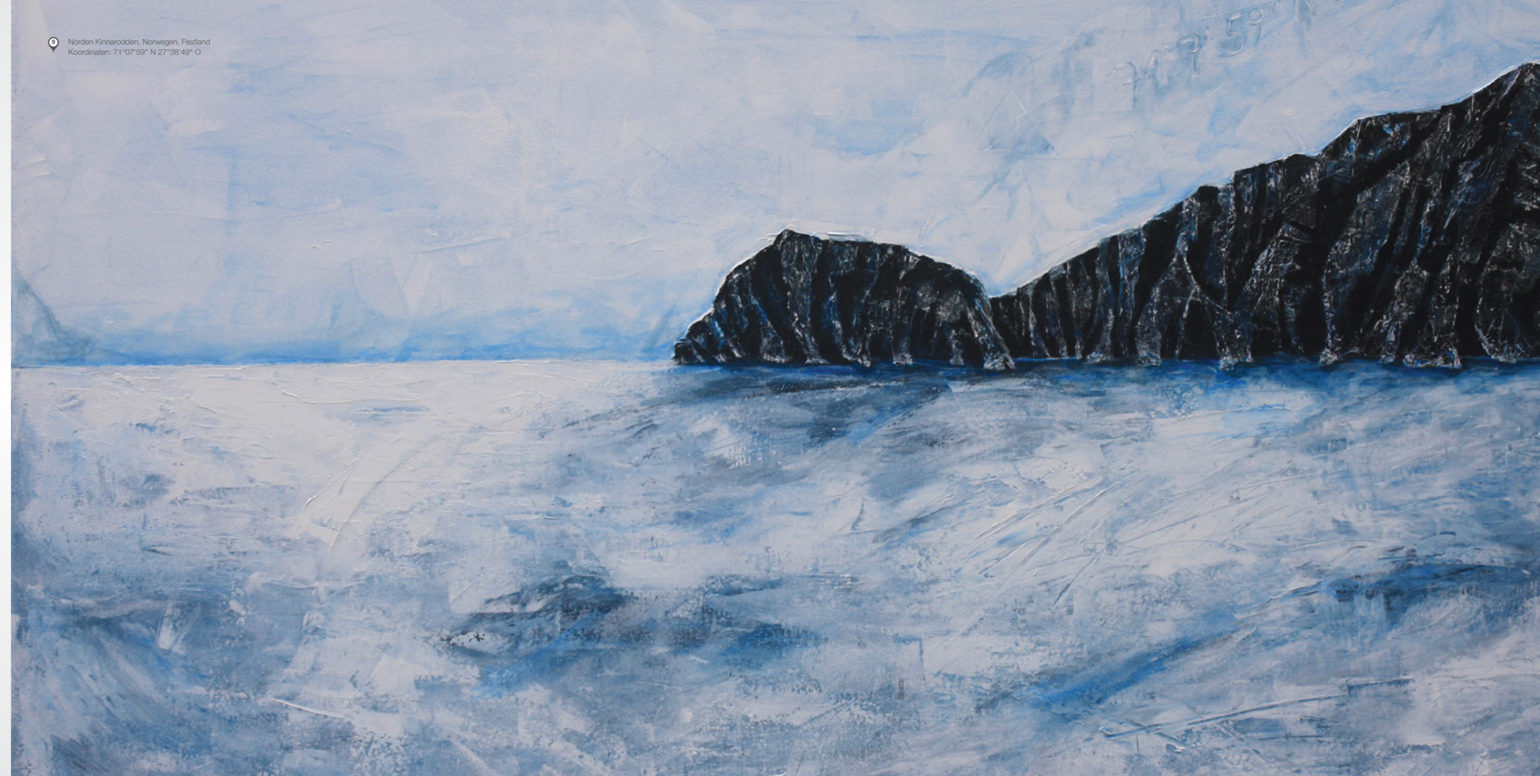
9 Norden Kinnarodden, Norwegen, Festland Koordinaten: 71°07'59" N 27°38'49" O