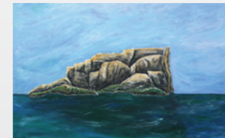
6 Westen Ilhéu do Monchique, Azoren, Portugal, Insel Koordinaten: 39°29'43" N 31°16'30" W