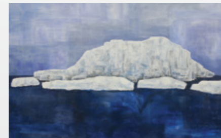
7 Norden Rossoya, Spitzbergen, Norwegen, Insel Koordinaten: 66°24'00" N 12°49'60" O