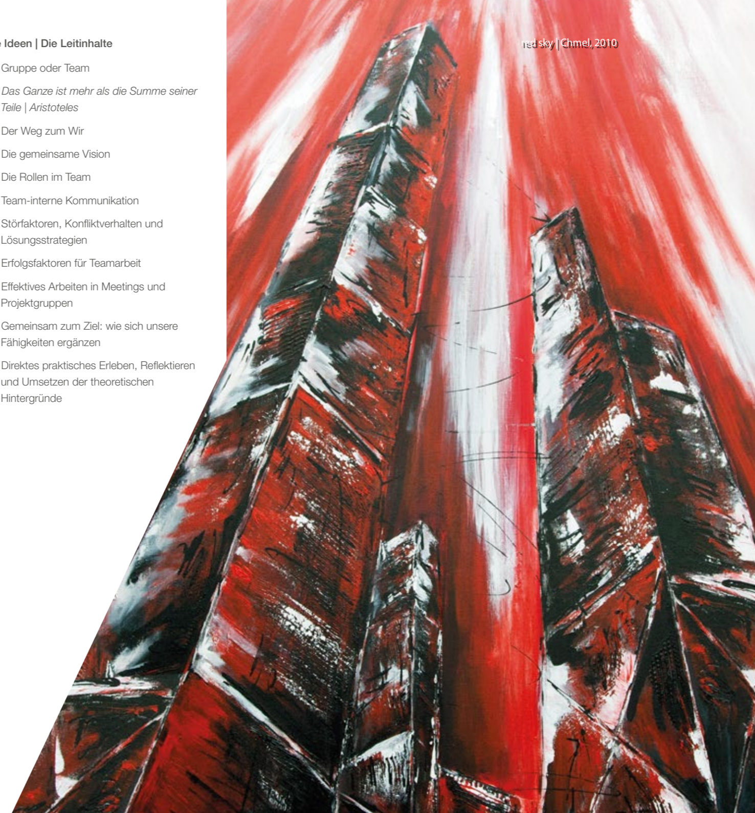
red sky | Chmel, 2010