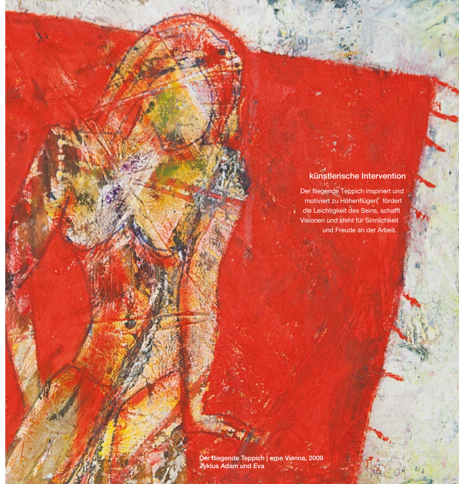
Der fliegende Teppich | erpe Vienna, 2009 Zyklus Adam und Eva